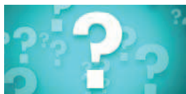
Foire aux questions (FAQ)

Sur notre site web ( www.amb-canada.fr/eic ), recherchez les icônes ci-dessous pour accéder à des explications supplémentaires ou pour obtenir davantage de renseignements vous permettant de mieux préparer votre séjour.